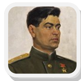
Алексей Петрович Маресьев

Алексей Петрович Маресьев - человек-легенда, прототип главного героя «Повести о настоящем человеке». Из-за тяжёлого ранения во время ВОВ ему были ампутированы обе ноги в области голени из-за гангрены. Однако, несмотря на инвалидность, лётчик вернулся в небо. Летал с протезами. Всего за время войны совершил 86 боевых вылетов, сбил 11 самолётов врага. А.Маресьев получил звание Героя Советского Союза.