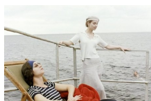
Кадр из к/ф «Дневник его жены»