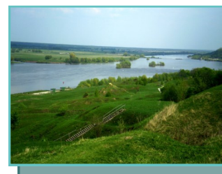
Родное село С.Есенина

Красота сама собою закрадывалась в душу юного Есенина и укреплялась там беспредельной любовью к Родине. Здесь он подружился на всю жизнь с молодой «зеленокосой», в «любчонке белой» березой; здесь навсегда стала бесконечно дорогой его сердцу «черная, потом пропахшая вить».