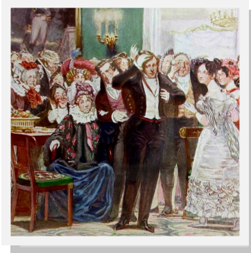
Чацкий Худож.-иллюстратор Д. Кардовский

Замысел создания пьесы «Горе от ума», вероятно, возник у Грибоедова в 1816 году. В это время он приехал в Петербург из-за границы и оказался на аристократическом приёме. Как и главного героя «Горя от ума», Грибоедова возмущала тяга русских людей ко всему иностранному. Поэтому, увидев на вечере, как все преклоняются перед одним иностранным гостем, Грибоедов высказал свое крайне негативное отношение к происходящему. Пока молодой человек разливался в гневном монологе, кто-то озвучил предположение о его возможном сумасшествии. Эту весть аристократы с радостью восприняли и быстро распространили. Тогда-то Грибоедову пришло в голову написать сатирическую комедию, где он мог бы безжалостно высмеять все пороки общества, так беспощадно к нему отнёсшегося. Таким образом, одним из прототипов Чацкого, главного героя «Горя от ума», стал сам Грибоедов.