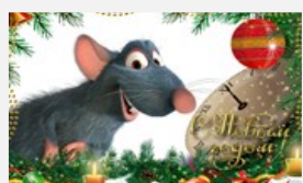
Хозяйка 2020 года

- Я ведь в Новом-то году Свой порядок заведу: Если кто будет лениться, Каждый день я буду сниться!