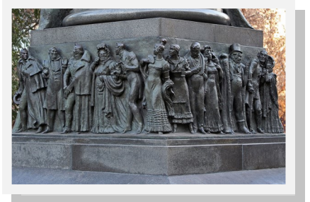
Горельеф на постаменте.

Горельеф — (франц. - рельеф, выпуклость) вид скульптуры, высокий рельеф, в котором выпуклое изображение сильно выступает над плоскостью фона (более чем на половину своего объёма).