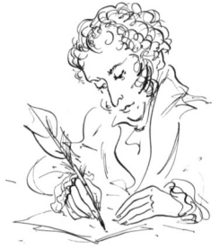
Пушкин о "Горе от ума". Письмо А. А. Бестужеву. Конец января 1825 г. Михайловское.

Покажи это Грибоедову. Может быть, я в ином ошибся. Слушая его комедию, я не критиковал, а наслаждался. ...»