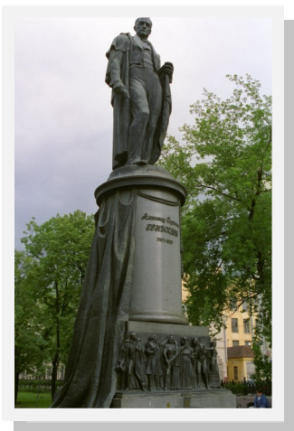
Памятник А.С.Грибоедову в Москве 1959 г.

Александр Сергеевич Грибоедов в Москве, на Чистых прудах, поставлен памятник. Это памятник и его бессмертной комедии. Посмотрите: вокруг постамента, из-за тяжёлых складок театрального занавеса, идут вереницей грибоедовские персонажи: самодовольный и напыщенный барин Фамусов: тупой, ретивый служака Скалозуб; злобная сплетница Хлестова; угодливо изогнувшийся Молчалин; расчётливая, ограниченная Софья; хитроватая служанка Лиза... Прочь от этой компании устремляется Чацкий. Он полон гнева и отчаяния.