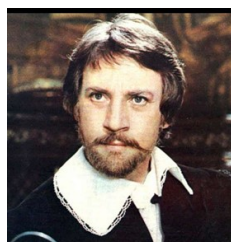
Кадр из к/ф «Маленькие трагедии»

За роль Галилея он был удостоен диплома I степени; спектакль «Гамлет» с его участием получил гран-при на фестивале БИТЕФ в Югославии.